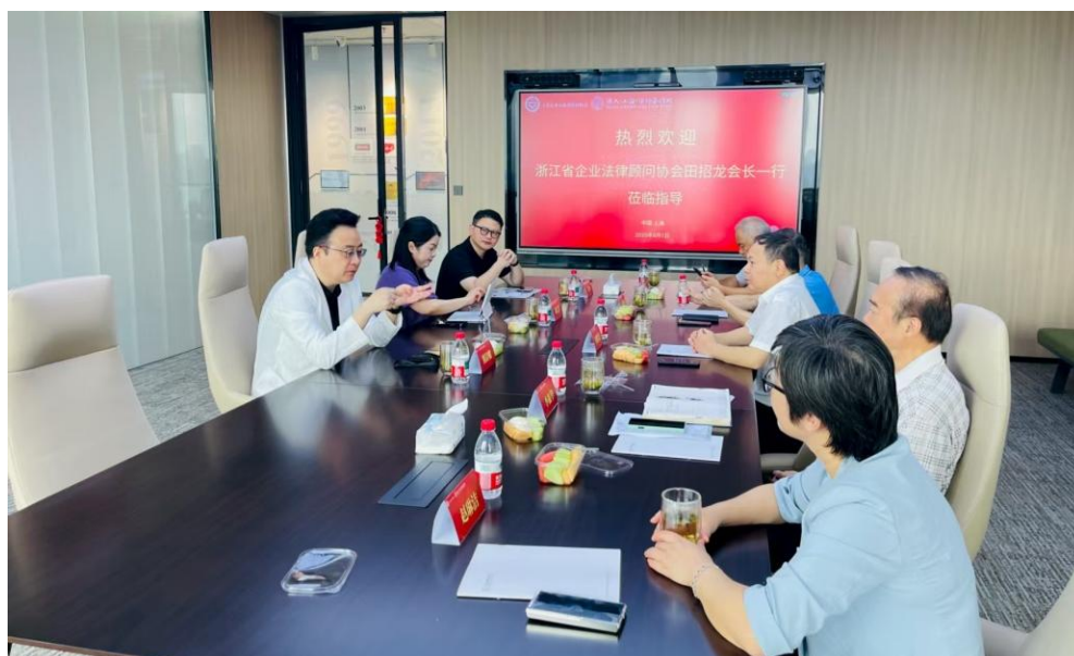
走访泽大（上海）律师事务所