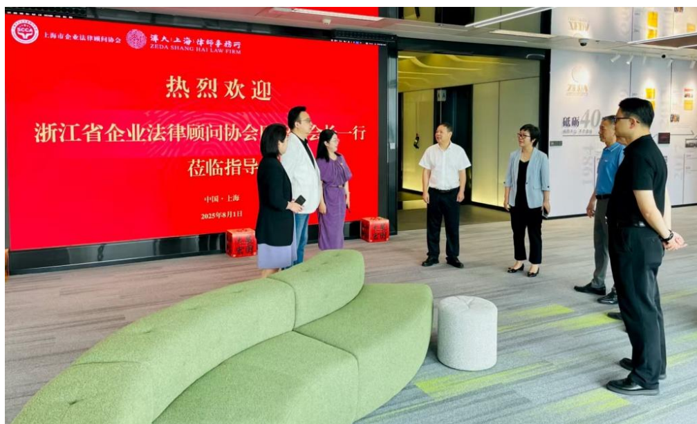
参观北外滩国际法律服务港